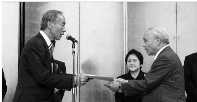
理事長より各種表彰状を贈呈