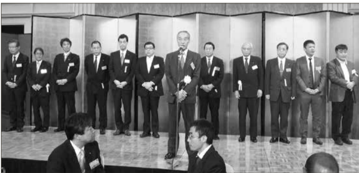
懇親パーティーでは、総会において選任された新役員を紹介