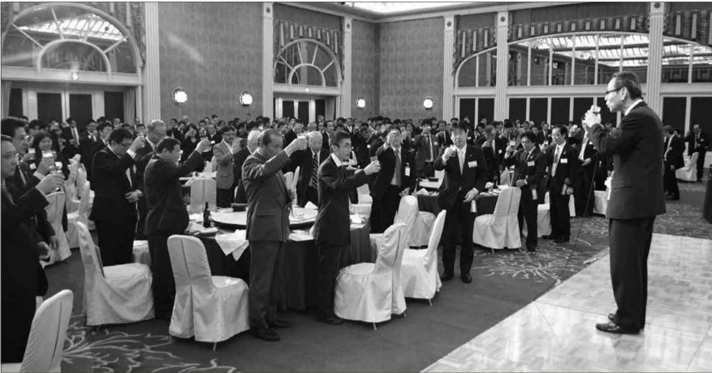
懇親パーティーは、中崇OATA連絡協議会副会長の乾杯の発声でスタート

協同組合大阪府旅行業協会は3月26日(木)、大阪市・上本町のシェラトン都ホテル・浪速の間において第40回通常総会終了後、OATA連絡協議会と「合同懇親パーティー」を開催した。来賓・招待35名、OATA連絡協議会229名、OATA組合員84名の計348名が参加した。