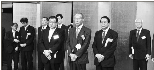
理事長をはじめ副理事長、専務理事の三役があいさつ